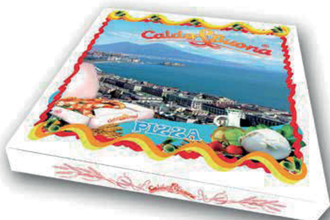
IMMAGINE E DISEGNO TECNICO