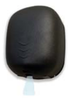
STREAM DRY UV NF