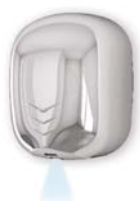
STREAM DRY UV LF