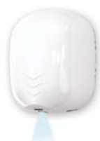
STREAM DRY UV ABS STREAM DRY UV BF