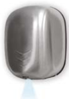
STREAM DRY UV SF